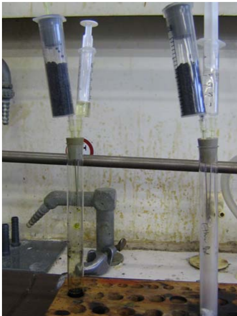
Gasentwickler (hier jeweils mit Aktivkohle-Absorber-Spritze)